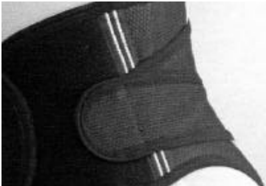
フィット感がパツグンのウエストベルト「エアーフイット」®

1日のうちで身に付ける時間が長くなれば、安全面も気になるところ。カプロンファイバーはパッチテストでその安全性は認定済み。しかもノンホルマリン素材を使用しているため、有害物質が肌に触れる危険性もない。従来のウエストベルトがコルセットのように硬いのは、メッシュ生地にメラミン樹脂を含